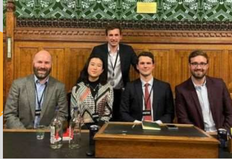
イギリス議会の調査員が中国のスパイとして起訴され、起訴が取り消された。